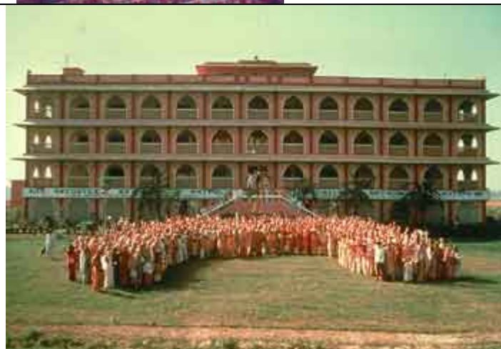
O quartel-general do movimento em Mayapur, West Bengal, Índia.