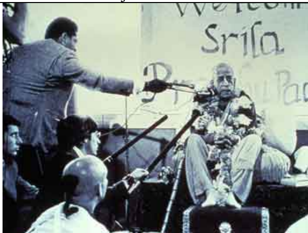
De volta aos Estados Unidos, Prabhupada é entrevistado pela imprensa.