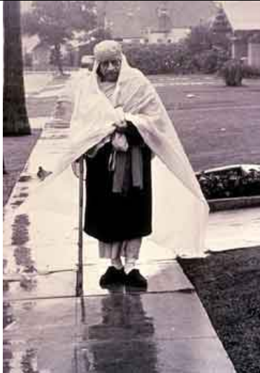
Caminhando na chuva.

Depois de três anos nos Estados Unidos, Prabhupada voltou à Índia. Nessa ocasião, ele fez questão de ficar nos mesmos aposentos do templo Radha-Damodara onde vivera antes de ir ao Ocidente. Aqui, Prabhupada conversa com velhos amigos de Vrindávana.