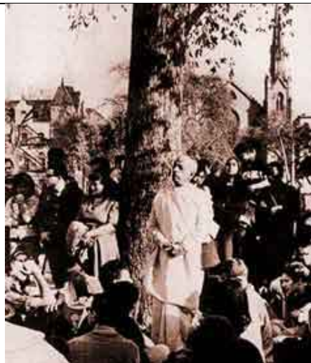
Prabhupada pregando numa praça em Manhattan, New York.