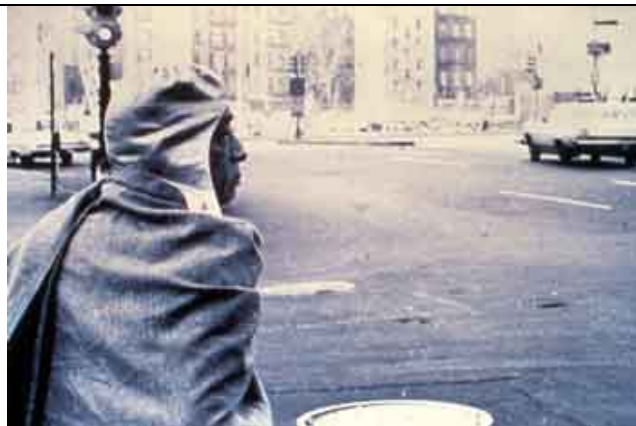
Os primeiros dias em New York.