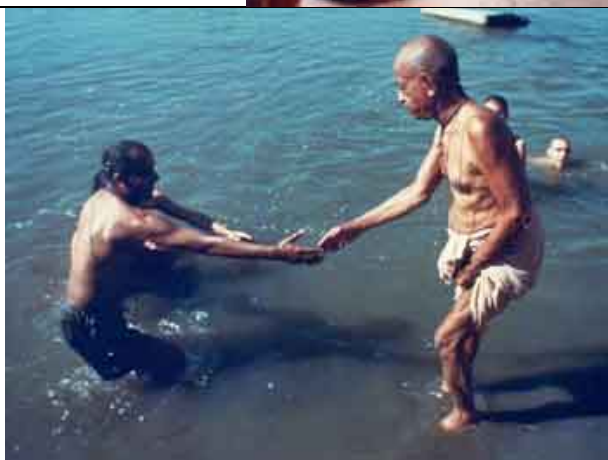
Banhando-se no Yamuna, em Vrindávana.