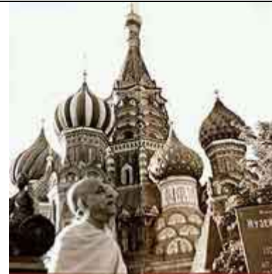
Prabhupada em Moscou.