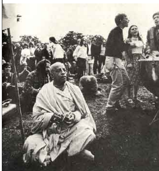
Em San Francisco, Prabhupada canta o maha-mantra num parque da cidade, com grande participação dos jovens.