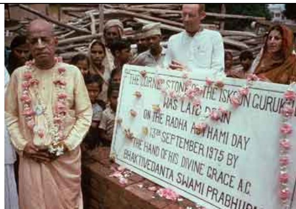
Em 1975, sua grande vitória: cerimônia da pedra fundamental do templo em Vrindávana.