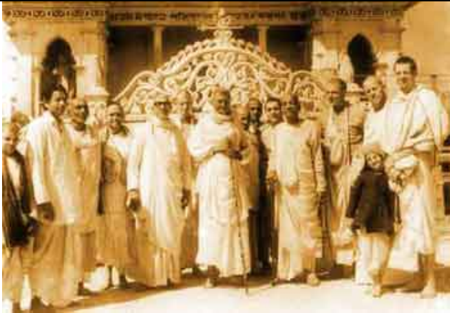
Prabhupada visita o templo de seu irmão espiritual Srila Sridhara Maharaj.