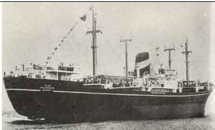
O cargueiro Jaladuta que trouxe Prabhupada aos Estados Unidos.