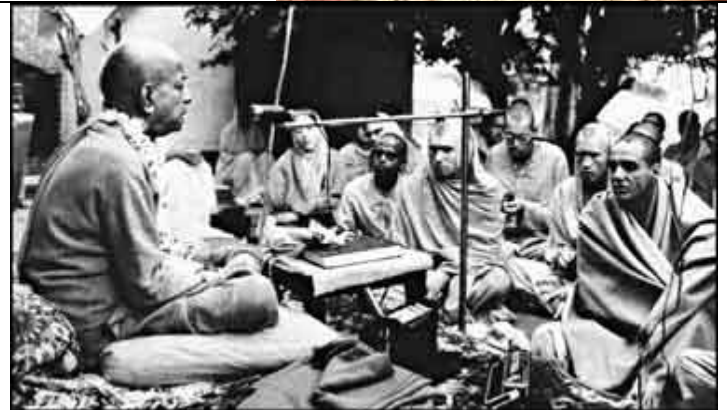
Em sua primeira volta a Índia, Prabhupada veio acompanhado por vários discípulos ocidentais. Prabhupada deu uma série de palestras no pátio do templo Radha-Damodara.