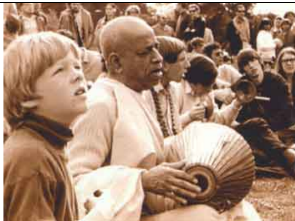
De New York, Prabhupada foi para a costa oeste, em San Francisco.