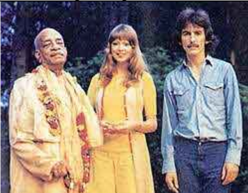
Em Londres, Prabhupada encontra-se com George Harison, que doou uma grande propriedade para sua missão.