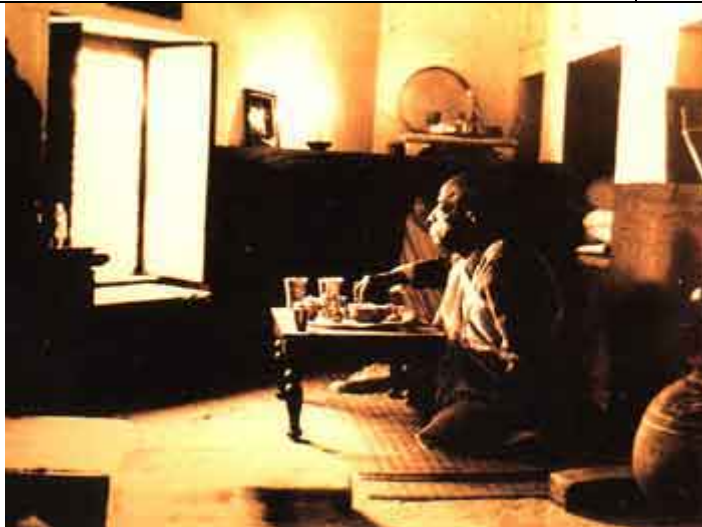
Prabhupada em seus velhos aposentos no Radha-Damodara.