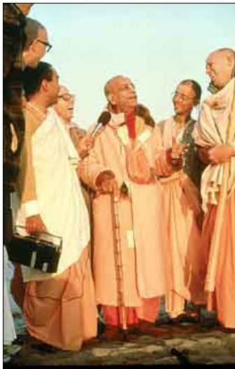
Instruindo os discípulos.