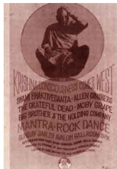
Cartaz da participação de Prabhupada no Mantra-rock Dance, em San Francisco.