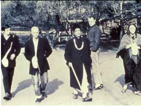
Depois de San Francisco, Prabhupada mandou alguns de seus discípulos para começar sua pregação em Montreal e Londres.