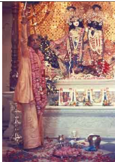
Primeiro arati a Sri Sri Krishna-Balarama no dia da inauguração do templo.