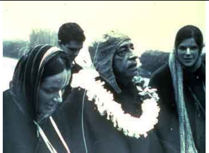
Prabhupada com algumas de suas primeiras discípulas.