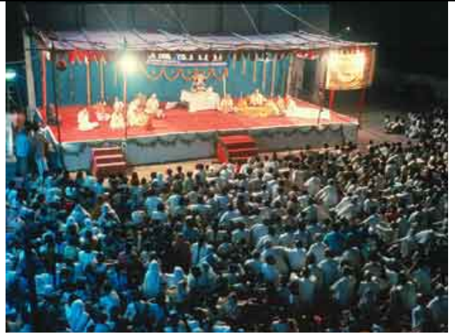
Concorrida pregação pública em Delhi.