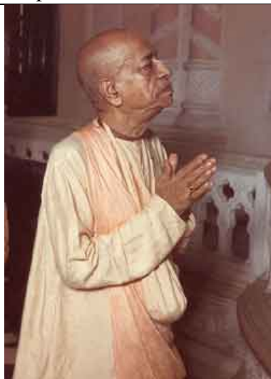
Devoção em Vrindavana.