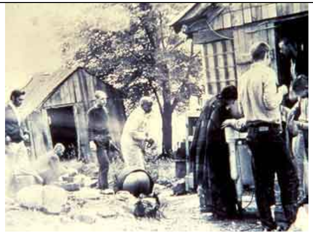
Primeiros dias do primeiro projeto rural nos Estados Unidos, New Vrindavana.