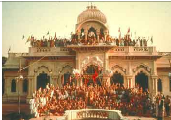
Templo Krishna-Balarama de Vrindavana